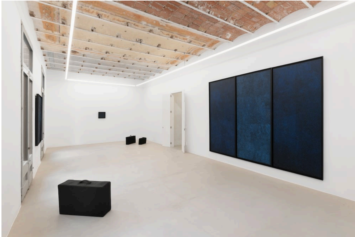
Exposició 'Back to Black' d'Enric Ansesa a l'AWL Gallery de Girona.

L'exposició 'Back to Black' es pot veure a AWL Gallery de Girona